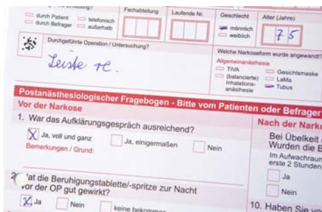
Abb.3: Qualitätssicherung durch kontinuierliche Patientenbefragung