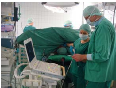
Abb. 2: Umfassende Patientenüberwachung durch modernste Monitorsysteme und quantifizierte Mitarbeiter

In der Herzchirurgie gibt es zu jedem in Teil B 3.3 angegebenen Qualitätsindikator eine Fokusgruppe. Bei einem monatlichem treffen werden Schwerpunkte gesetzt, sowie Leitlinien und Gesamtkonzepte erarbeitet und herausgegeben.