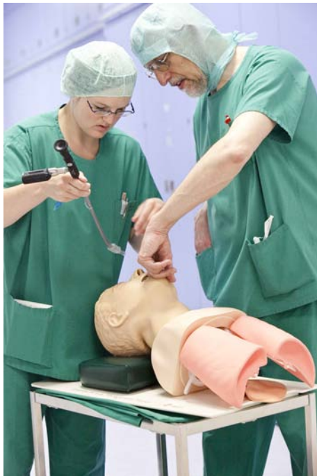
Abb.1: Intensive Aus- und Weiterbildung in der Klinik für Anästhesie