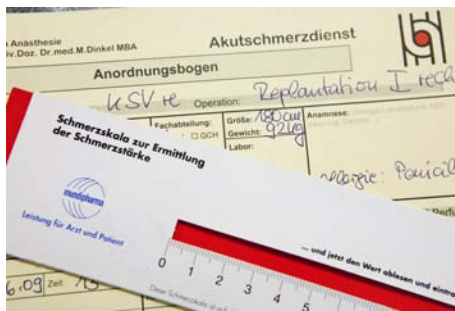
Abb.2: Verlaufsdocumentation im Rahmen des Akutschmerzdienstes